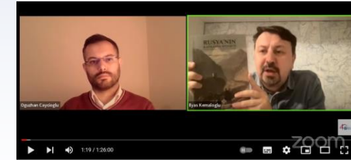
MTK2022 | S. Oğuzhan Çaycıoğlu | Çarlık Rusya'nın Kafkasya Siyaseti (18-19.yy)